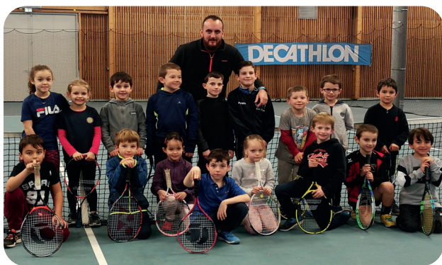
Plateaux rouge de janvier et février au TCL

lieu en janvier et février, ont rassemblé pas moins de 40 enfants du TCL et des clubs voisins. Quant au tournoi d'hiver de février, il a également attiré plus de 130 joueurs. Les résultats des vainqueurs au prochain numéro.