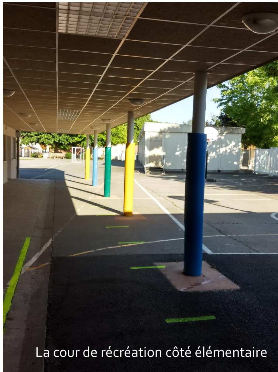
La cour de récréation côté élémentaire