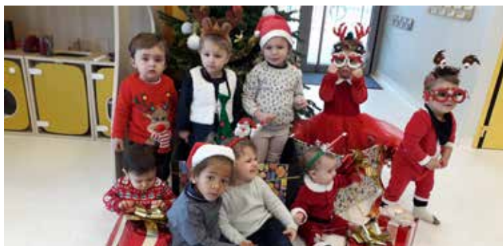
R.A.M. «Nos cadeaux à nous»