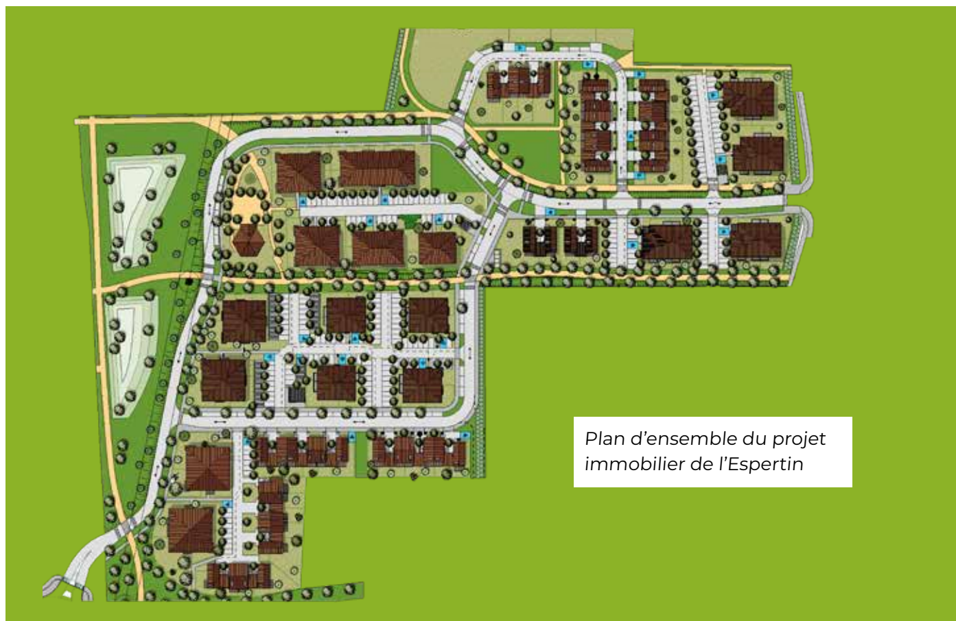
Plan d'ensemble du projet immobilier de l'Espertin

La Municipalité a souhaité créer de véritables lieux de vie où la nature prend sa place. L'intégration d'un verger permettra aux Lespinassoises de s'évader le temps d'une promenade à travers pommiers et pruniers. La végétation composée de cédrèles de Chine, de Tulipiers, d'arbres fruitiers et de nombreuses autres essences jouera également son rôle en créant une mise à distance avec la rue et éviter ainsi les contacts directs visuels et sonores entre les habitations.