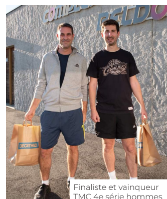
Finaliste et vainqueur TMC 4e série hommes

Par ailleurs, nos 2 équipes féminines engagées en Challenge Hermet ont toutes terminé 1ère et 2e de poule, et atteignent ainsi le tableau final de cette compétition. Nos 2 équipes masculines tirent également leur épingle du jeu en terminant chacune 2e de poule. L'AG2R et le Valence d'Agen sont toujours en cours.