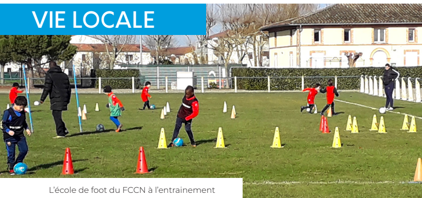
L'école de foot du FCCN à l'entraînement