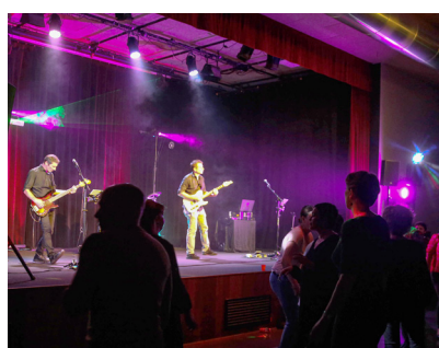
Le Groupe FUZZ

- À partir du 15/12/2021 pour les extérieurs