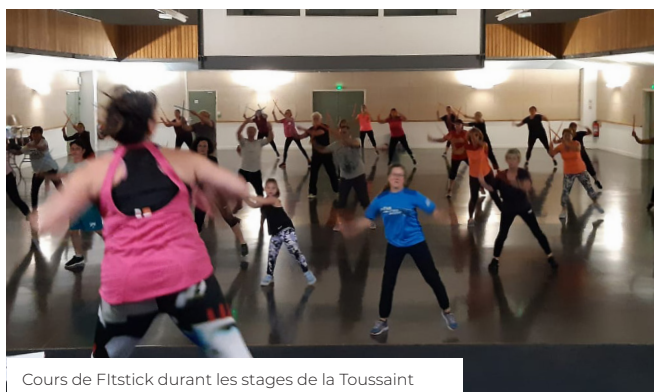
Cours de Fitstick durant les stages de la Toussaint