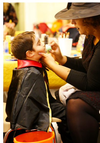
Séance maquillage lors d'Halloween