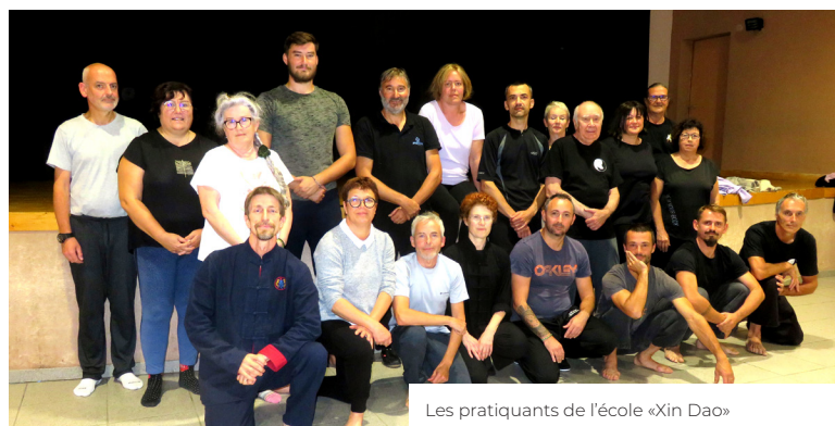
Les pratiquants de l'école «Xin Dao»