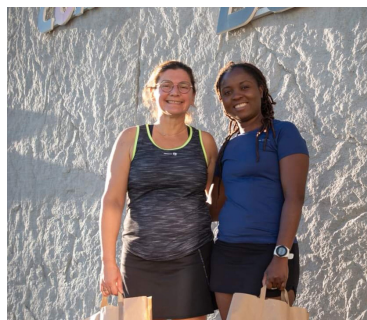
Finaliste et vainqueur TMC 4e série dames