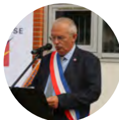
Alain ALENÇON, Maire de Lespinasse