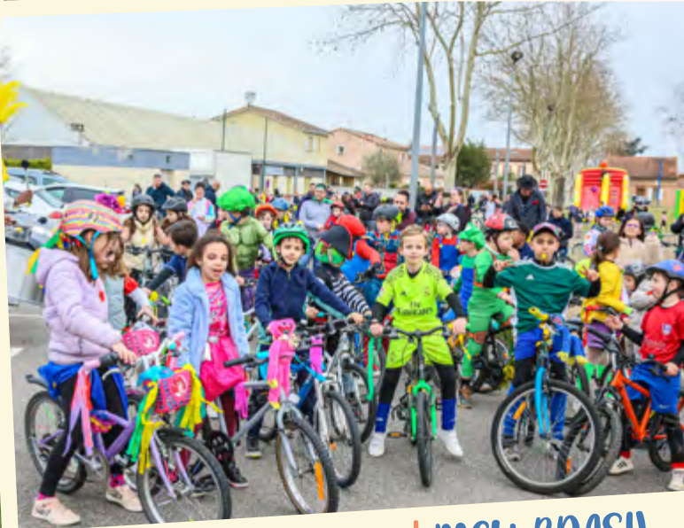
Soirée Brésilienne | MEU BRASIL