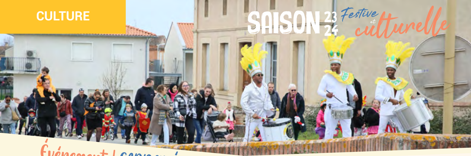
Événement | CARNA'VÉLO